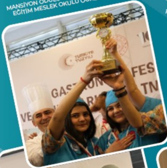
MEB GASTRONOMİ FESTİVALİ VE YEMEK YARIŞMASI MANSİYON ÖDÜLÜ KONYA KARPATAY ÖZEL EĞİTİM MESLEK OKULU ÖĞRENCİLERİ